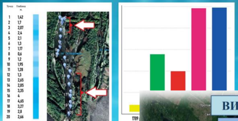
Дослідження озера Осокорове (точки та значення вимірювання глибини) восени 2019 року

До 10 слайдів про ключові результати дослідження